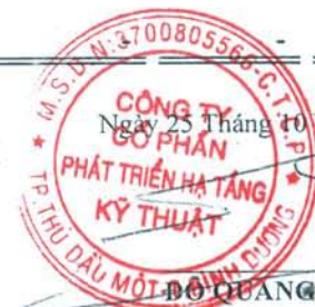
Tổng Giám đốc